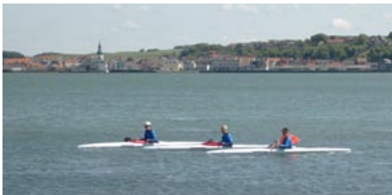
De 3 nye kajakker på vandet. Mars, Merkur og vestjyskBank