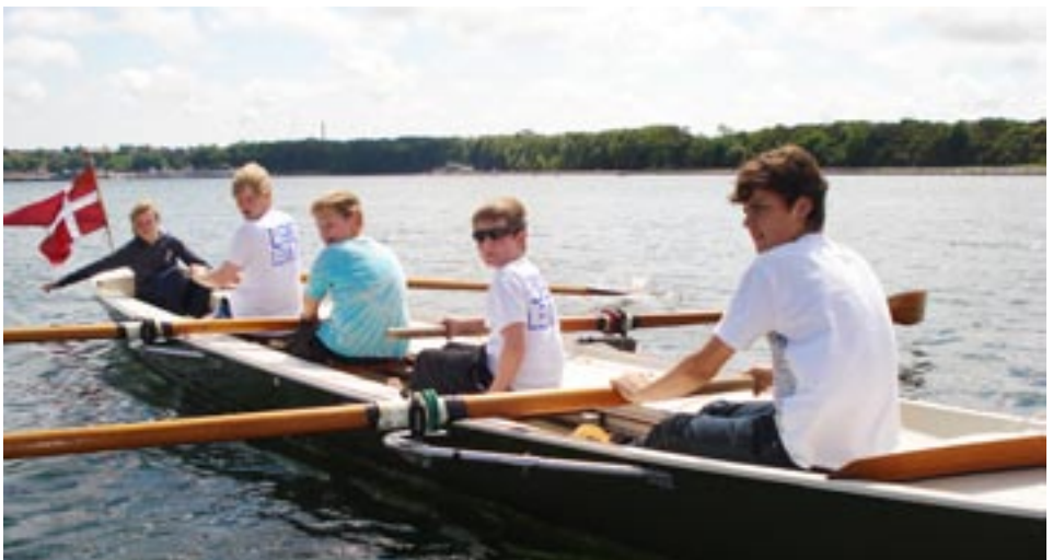
Jubilæumsroningen 14. juni 2009