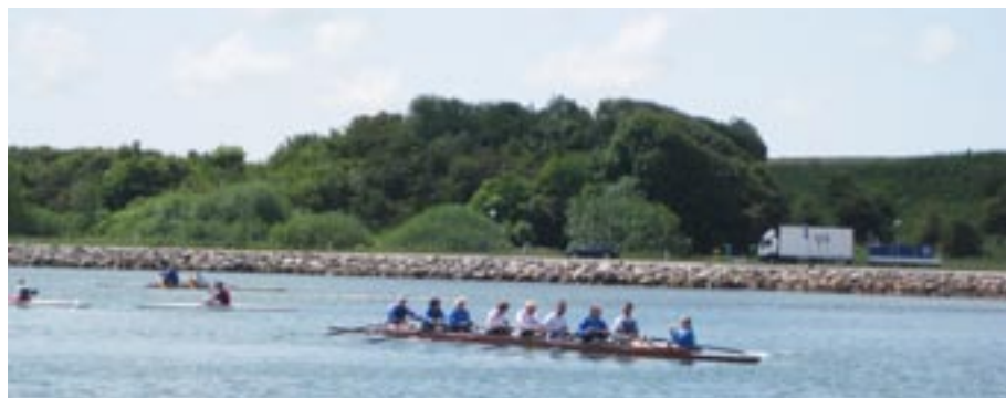
Jubilæumsroningen 14. juni 2009