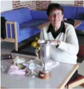
Stor aktivitet sidste arbejds- onsdag, der sluttede med frokost.