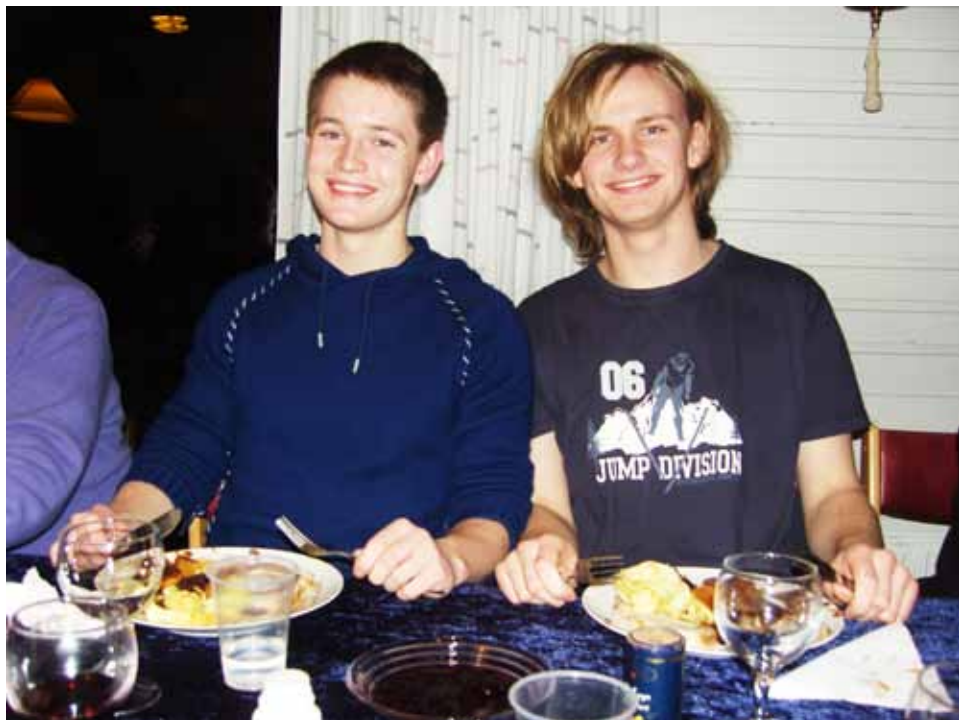
To der nød den gode mad ved klubbens generalforsamling. (Det er 3. portion)